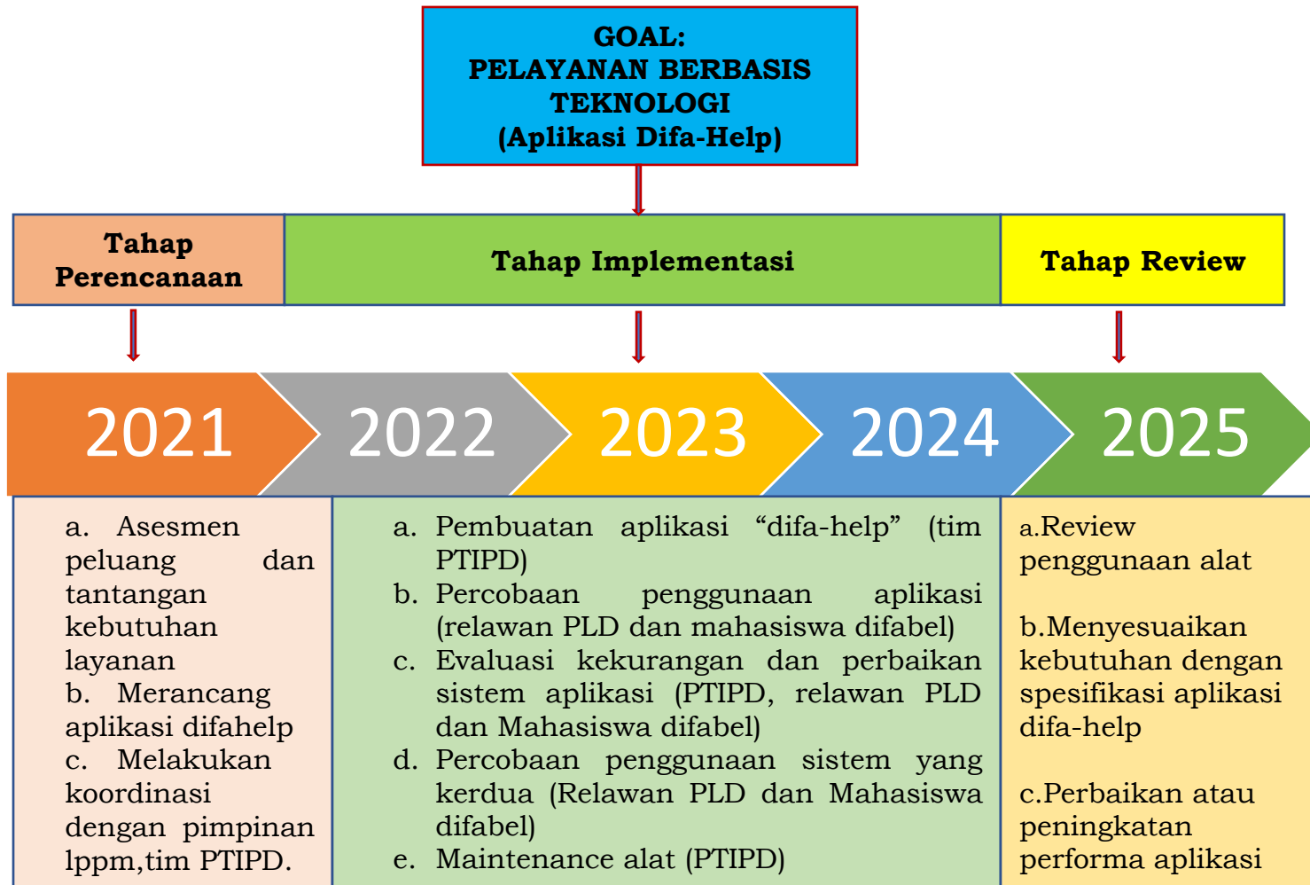
BAGAN 3.1. PETA LAYANAN PLD